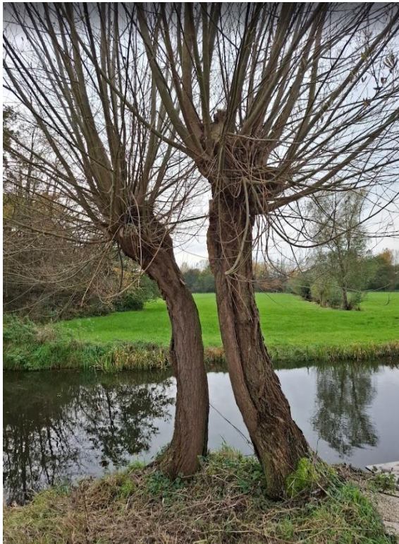
Oude wilg waar alleen de zijanten nog van over zijn