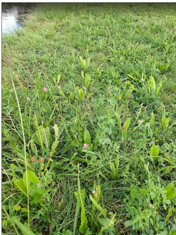
Kruidenrijke bufferstrook langs een sloot