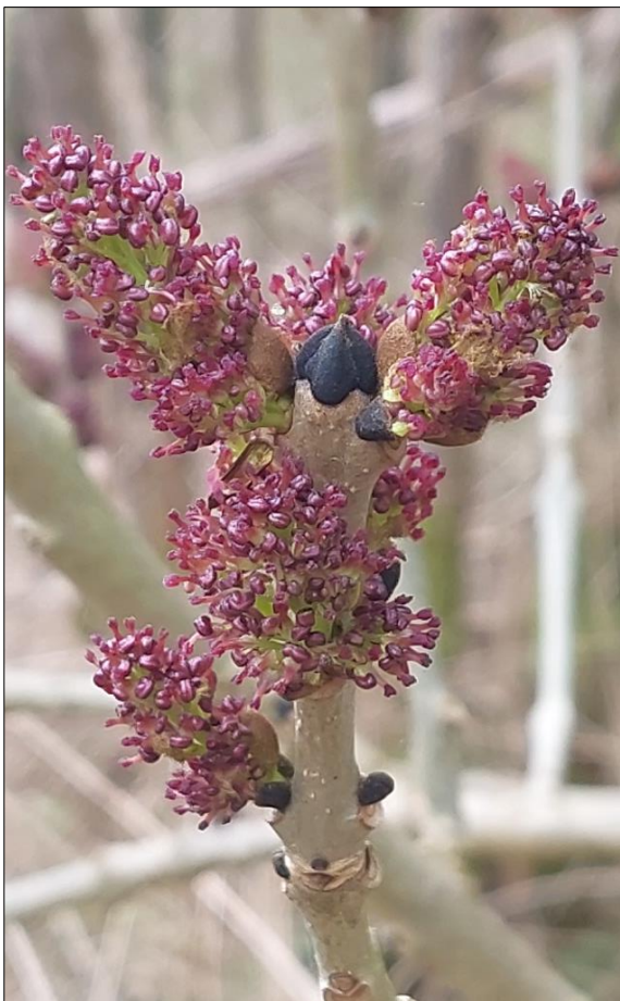
Bloeiwijze van de gewone es