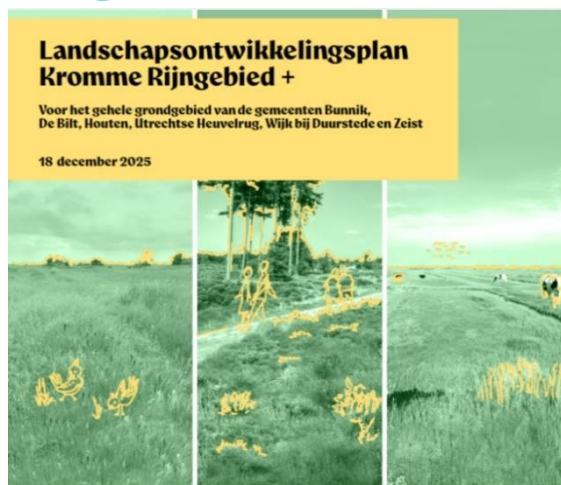
Voorblad geactualiseerde LOP