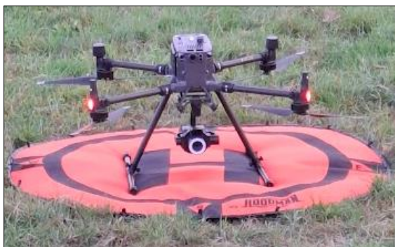
Slimme weidevogeldrone werkt met AI