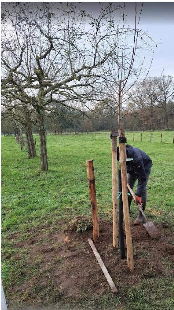
Aanplant hoogstamappelboom bij herstel boomgaard