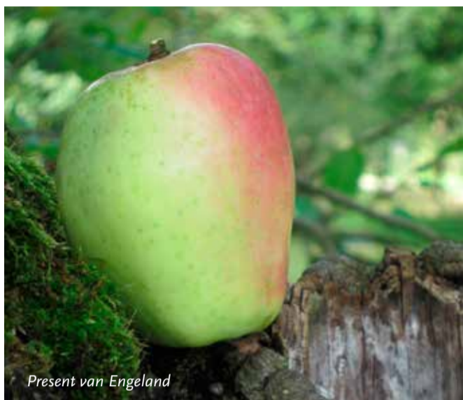
Present van Engeland