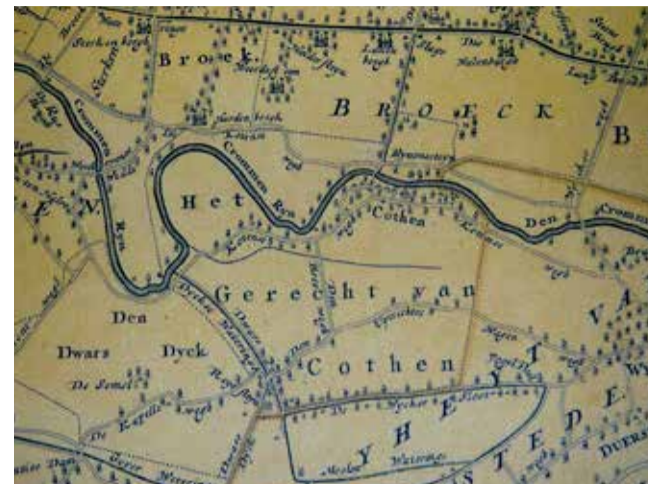
Uitsnede kaart uit 1743

Hoe zag jouw landschap eruit in de tijd van Napoleon? Via www.topotijdreis.nl ga je zomaar 200 jaar terug op topografische kaarten. Zoeken kan op je eigen postcode. Een leuke manier om je landschap te begrijpen en inspiratie op te doen voor nieuwe aanplant. ■