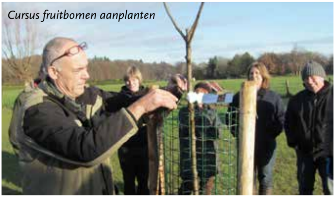
Cursus fruitbomen aanplanten