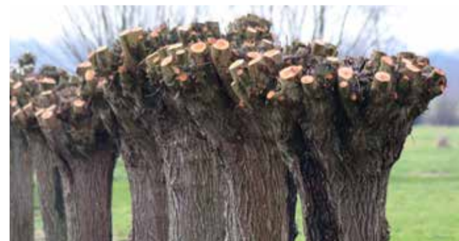
Handzaagwerk geeft nette snoeiwonden.