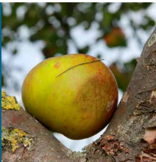
Foto: appelsoort James Grieve