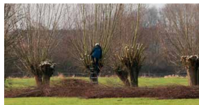
Knotwilgtakken zaag je in twee keer. Zo voorkom je dat de boom inscheurt.

Meld je aan voor de digitale nieuwsbrief op www.krommerijnlandschap.nl . En probeer onze website uit. De perfecte website bestaat niet. Voor de landschapscöördinator is het vooral belangrijk dat je snel de informatie kunt vinden die je zoekt. Vandaar dat we graag een tijdje proef draaien en van jou horen wat je van onze nieuwe site vindt. ■