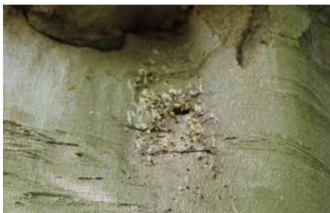
Poep als indicatie dat er mogelijk vlermuizen in de boom zitten.