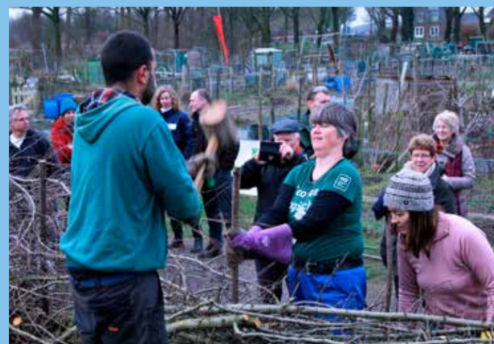
Heggenvlechten met publiek

Het kampioenschap werd mede mogelijk gemaakt door de inzet van veel vrijwilligers en de sponsors B&B Klein Groenbergen in Leersum en het Ondernemersfonds Wijk Bij Duurstede.