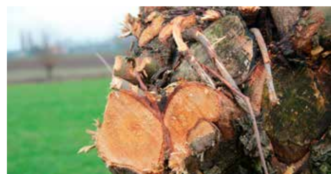
Met kettingzaag snoeien heb je grotere kans op lelijke en te grote zaagwonden.