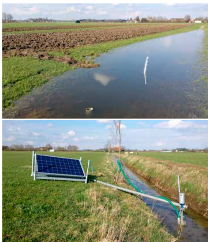
Boven: Plasdras strook, onder: pomp met zonnepaneel, foto's Maarten van Beek.

Volg ons op Facebook-Kromme Rijnlandschap en schrijf je in voor onze digitale nieuwsbrief: www.krommerijnlandschap.nl/nieuws