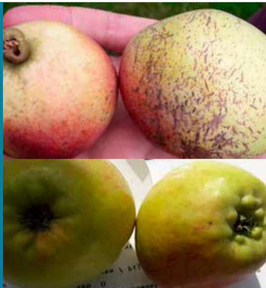
boven: Hollandse peer: Witte Cousin, bekend rond 1700. Onder: Hollandse appel: roggezoet bekend rond 1850.