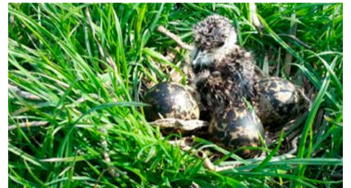
Kievit pul en ei

Voor vragen over de vereniging kun je terecht bij Maas Merkens en Freerk de Boer: boerdefreerk@gmail.com . Voor subsidieaanvragen agrarisch natuurbeheer 2019, kun je terecht bij het collectief: Hein Pasman, h.pasman@collectiefutrechttoost.nl , 06 46 06 17 45. Of Hans Veurink, h.veurink@collectiefutrechttoost.nl , 06 53 70 10 00. ■