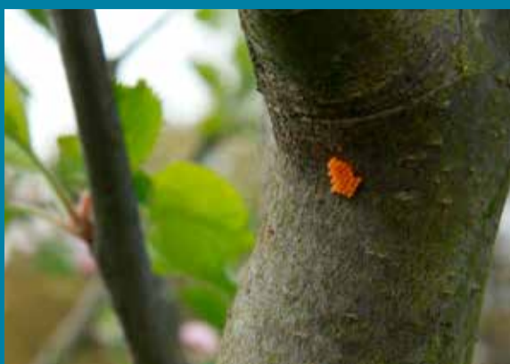
Boven: zweefvlieg, onder: een eipakket van lieveheersbeestjes

en andere insecten. En gifvrije tuinen en boomgaarden helpen in het toenemen van de populaties. Sluipwespen, gaasvliegen roofwantsen en appelroofmijt zijn ook natuurlijke vijanden van luizen, trips, bladvlooiën en kleine rupsen. Ze helpen het fruit gezond te houden. En dat allemaal voor de prijs van een pakje bloemenzaad. Insecten zijn goud waard! Wie de moeite neemt insecten van dichtbij te bekijken, zal zich verbazen hoe mooi ze zijn. ■