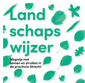
Voorkant landschapswijzer, naast gedrukt ook digitaal beschikbaar