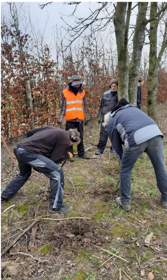
Inplanten houtsingel door houtgroep t Burgje van Reinaerde in Odijk