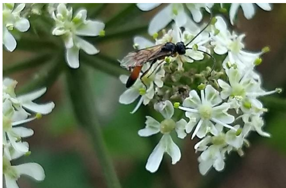
Sluipwesp op bloem fluitenkruid