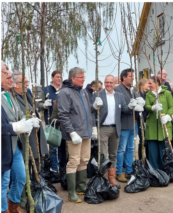
Bestuurders krijgen uitleg over bomen planten bij ondertekening verlenging Platform kleine landschapselementen