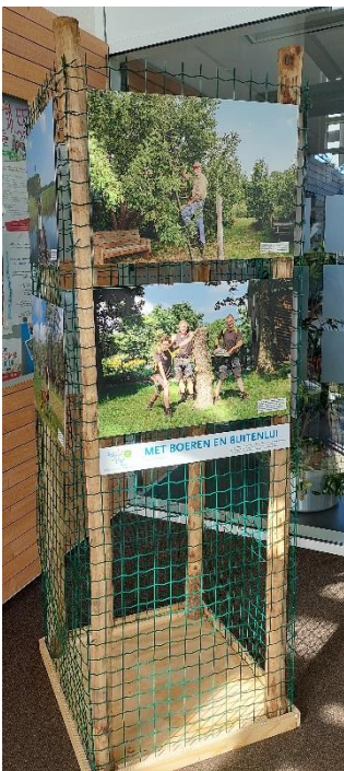
Boomkorf met portretten