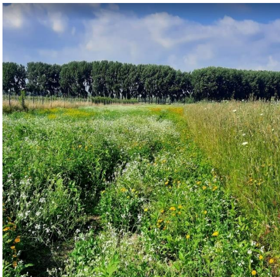
Bij Nieuw Slagmaat in Bunnik zaten in 2021 patrijzen met jongen