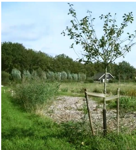
Eetbare soorten in het Langbroekse landschap