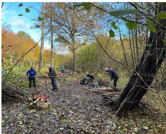
Kappen hazelaarhakhout op Sandenburg