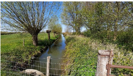
Voorjaar in De Goiren in Odijk