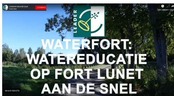
Voorbeelden van leader filmpjes van Krommerijnprojecten