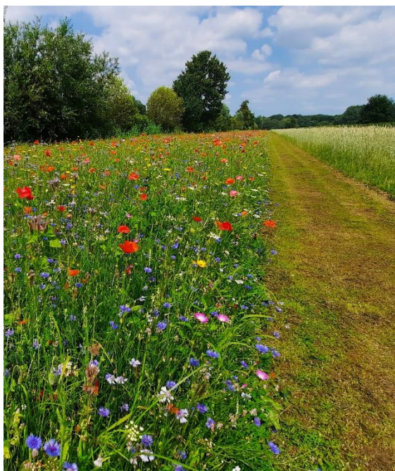
Bloeiende akkerrand naast graan in Doorn