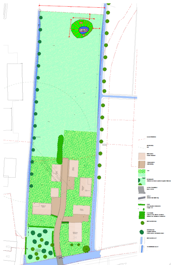
Landschappelijke inpassing met hoogstamboomgaard, heggen, knotbomenrijen kruidenrijk gras en poel