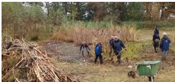
opschoonwerk aan de poel