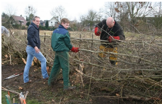
Vlechtheg kampioenschap in volle gang