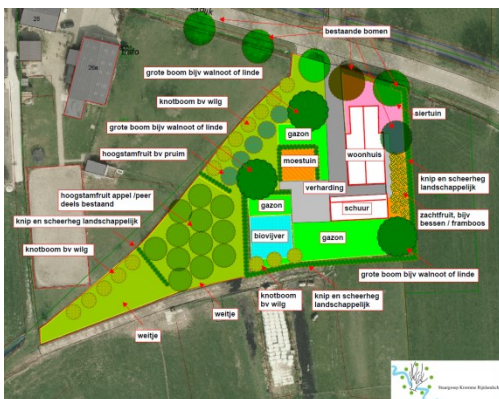
Functieverandering naar wonen waarbij landschapselementen worden toegevoegd