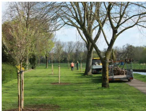
Aanplant langs kromme Rijn

Met het hoogheemraadschap Stichtse Rijnlanden en de gemeente Bunnik is al in 2015 een plan gemaakt welke bomen en struweel er langs de Kromme Rijn geplant kunnen worden na de aanleg van de natuurvriendelijke oevers. Er is gekeken naar aansluiting bij het onderliggend landschapstype, grondsoort en vochttoestand. Ook is gelet op biodiversiteit door bijvoorbeeld toepassen van meer soorten met bloemen (stuifmeel, vruchten en schuilgelegenheid). Er is zoveel mogelijk gebruik gemaakt van autochtone beplanting. Dat wil zeggen. Planten van zaden van planten waar de ouders en verre voorouders uit Nederland komen. Die zijn namelijk sterker en beter aangepast aan de omstandigheden van hier. De scholen in Bunnik zijn benadert om met de boomfeestdag mee te helpen met inplanten. Door drukte in het schoolprogramma hebben ze hier allemaal niet aan meegedaan, wat erg jammer is. In het project zijn 81 bomen geplant bestaand uit o.a. zwarte els, fladderiep, linde, zwarte populier, zomereik en boskriek. Er zijn 1750 stuks struweel geplant bestaande uit meidoorn, hazelaar, vuilboom bloedrode kornoelje en gewone vlier.