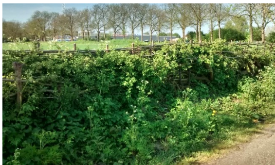
Resultaat in de zomer van 2016