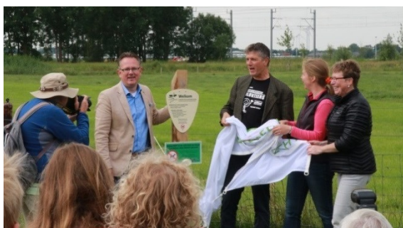
Opening pad door Wethouders van Bunnik en Houten en eigenaresse Nieuw Slagmaat

jaarverslag 2016, Stuurgroep Kromme Rijnlandschap