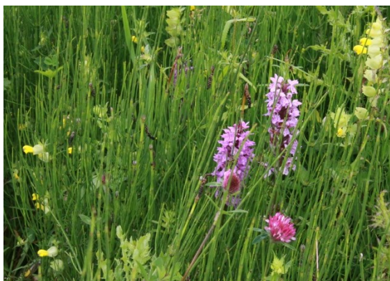
Gevlekte orchis en ratelaar ergens in de streek

Stuurgroep Kromme Rijnlandschap is een gebiedsgericht samenwerkingsverband van zes gemeenten en de provincie voor natuur en landschap in het Kromme Rijngebied. Het samenwerkingsverband bestaat al sinds begin jaren zeventig en is destijds opgericht om de zogenaamde “stille recreatie” in het gebied te bevorderen. Tegenwoordig wordt steeds meer ingezet op behouden en verbeteren van ruimtelijke kwaliteit in de breedste zijn van het woord. Naast de participerende gemeenten en provincie Utrecht zijn ook een aantal adviesorganisaties vertegenwoordigd. Op deze manier is een echt gebiedsgerichte afstemming en samenwerking mogelijk voor het natuur- en landschapsbeleid.