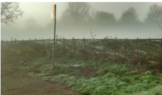
Vlechtheg na het kampioenschap