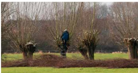
Knotwilgtakken zaag je in twee keer. Zo voorkom je dat de boom inscheurt.