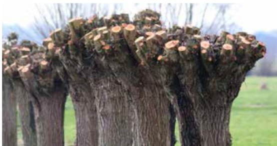
Handzaagwerk geeft nette snoeiwonden.

Voorbeeld van de landschapswiki knotbomenbeheer op de website